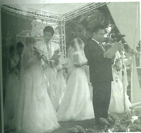
佳賓林錫耀縣長帶領新人們宣讀愛的宣言

為迎接「淡水古蹟園區」的開園，台北縣政府積極進行紅毛城週邊環境的整體景觀規劃，將砲台埔頂古蹟區的街道管線地下化，也趕工完成馬偕歷史步道的營建。由此我們可以預期「淡水古蹟園區」的開園運作，亦將持續促進淡水歷史風貌的重整，或許在紅毛城週邊的整體景觀風貌改善之後，淡水老街「崎仔頂」古蹟區祖師廟週邊景觀以及捷運淡水站前廣場和站後公園與週邊歷史風貌的整合，會是馬上須要關注的課題！