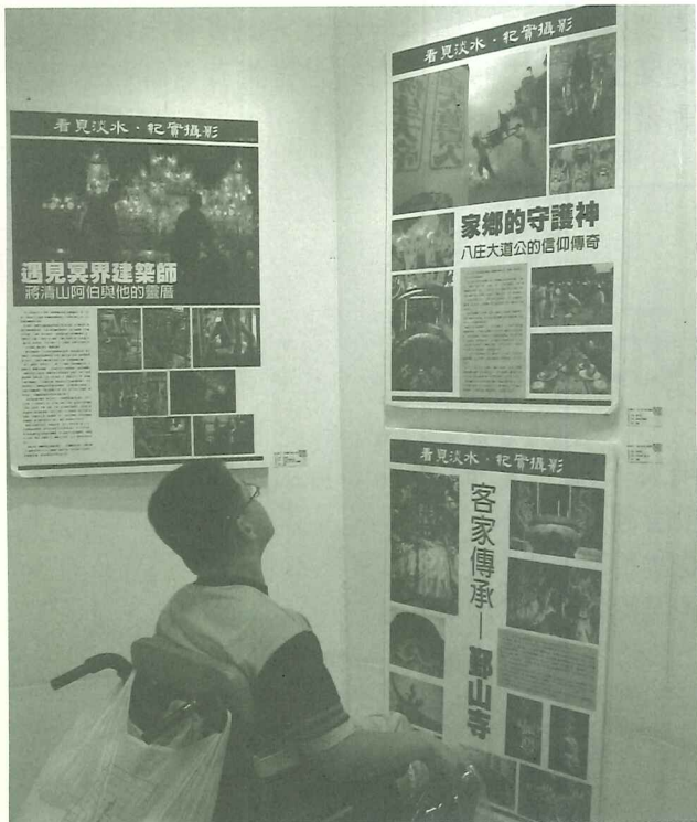
「看見淡水·紀實攝影」班學員獨特攝影構思，讓觀眾咀嚼再三

淡水社大長期推動社區學程，實施「社區本位·公共論壇」，並鼓勵老師融入在地資源教學、與社區互動，此次的參展迴響對於淡水社區大學向來堅持的辦學理想有莫大的鼓舞，作為一所在地思維的社區大學，淡水社區大學的深耕已逐漸展現光華。