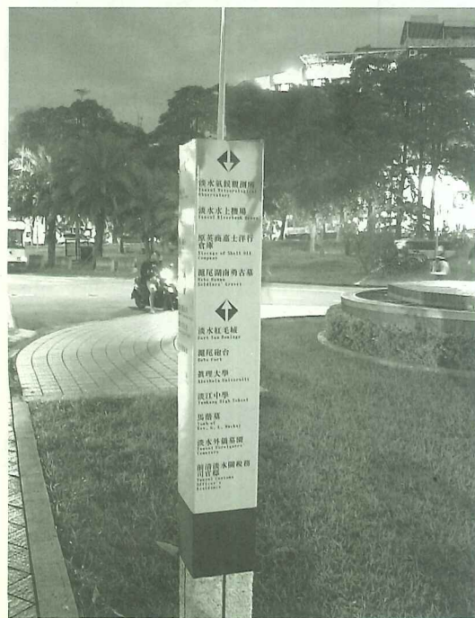
淡水古蹟博物館在淡水地區設立古蹟位置方向指引

縣政府利用十一月十二日、十三日、十九日、二十日四個週末假期更推出「馬偕之路——集章動」，從捷運淡水站到滬尾砲台分設七個站，讓遊客徒步走訪馬偕歷史之路。而十一月十九日下午七點在滬尾砲台舉行的「砲台懷舊音樂會」，和十一月二十日在紅毛城舉行的「泰迪熊遊淡水」，加豐富這次開園活動的文化氣息，突顯淡水古蹟區開園的歷史交會意義！