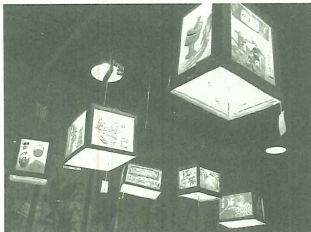
「亞洲婦女國民美術」班學員的燈籠創意十足，更結合老街古樸之美

的創意燈籠參展，學員以水彩畫在棉紙上利用廢紙箱，製作成古樸又新創的燈籠，還別上精心製作的仿真門牌相當有趣，獨樹一格的懸掛在展場，吸引不少讚嘆的眼光；而淡水社區大學「看見淡水·紀實攝影」班則以主題式的攝影加上文字編排類似報紙版面的樣貌，透過鏡頭帶領大家看見不同視野的淡水景象，而以大圖輸出的方式呈現，更突破一般攝影展示的圍限，在眾多攝影作品內顯得突出，令人驚豔。